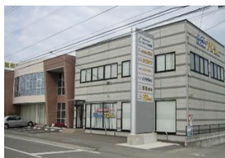
【四国進学会藍住校】